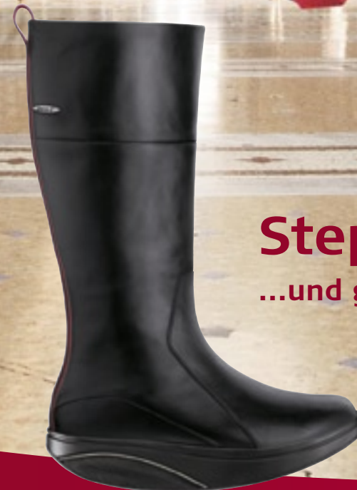
Tenga High Black

Step into a stronger body ...und gönnen Sie sich etwas ganz Besonderes.