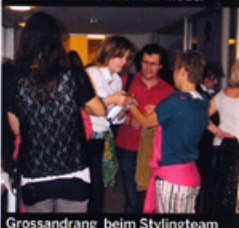
Grossandrang beim Stylingteam