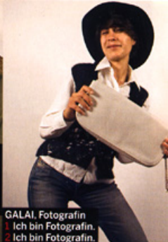
GALAI , Fotografin 1 Ich bin Fotografin. 2 Ich bin Fotografin.