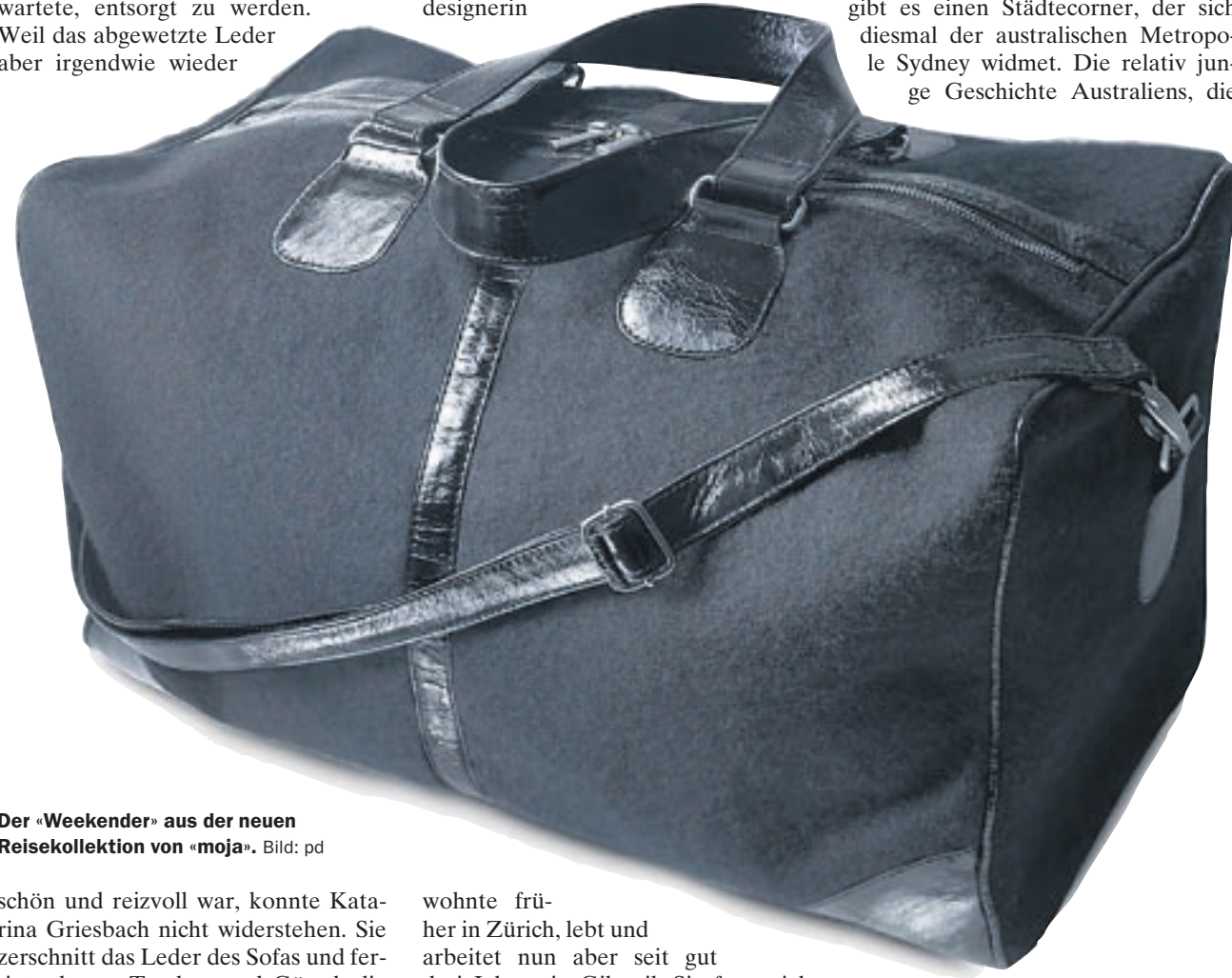
Der «Weekender» aus der neuen Reisekollektion von «moja».