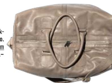
Weggefährte Lederweekender, Griesbach & Co. www.griesbachweb.com ► CHF 860.-