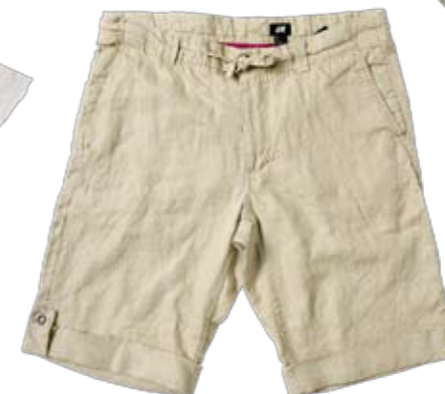
Luftikus Leinen-Shorts zum Binden von H & M. ► CHF 34.90