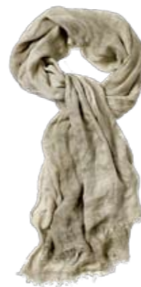
Wüstenfuchs Schal mit Fransen, Faliero Sarti, Fidelio. ► CHF 269.-