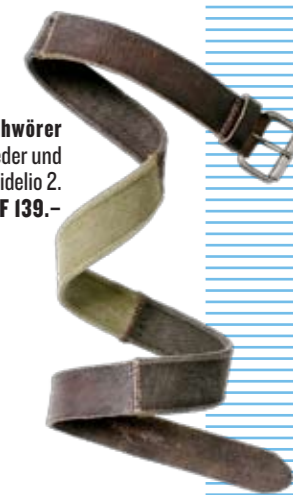
Schlangenbeschwörer Gürtel aus Leder und Stoff, Vintage, Fidelio 2. ► CHF 139.-