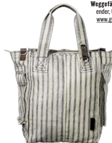
City-Tramp Grosse Handtasche von Property of bei Fidelio. ► CHF 339.-