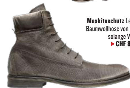
Moskitoschutz Leichte Baumwollhose von Zara, solange Vorrat. ► CHF 89.90