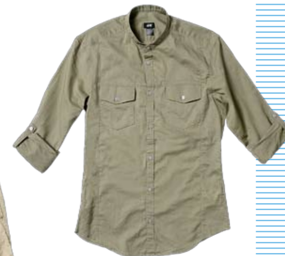
Dschungelcamp Hemd mit Nehru-Kragen von H & M. ► CHF 29.90