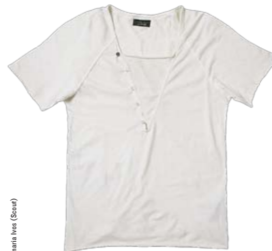
Best Buddy T-Shirt mit Zierknöpfen, Zara. Solange Vorrat. ► CHF 35.90