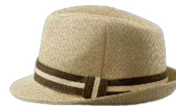
Schattenspieler Formschöner Stroh-Trilby von Coop City. ► CHF 29.90