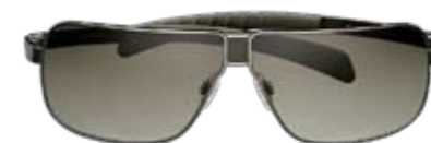
Vielflieger Sonnenbrille von Adidas, gefunden bei Visilab. ► CHF 305.-