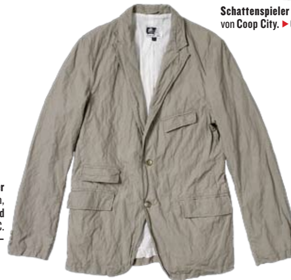
Nonstop-Begleiter Leichter Veston, Engineered Garments, VMC. ► CHF 398.-