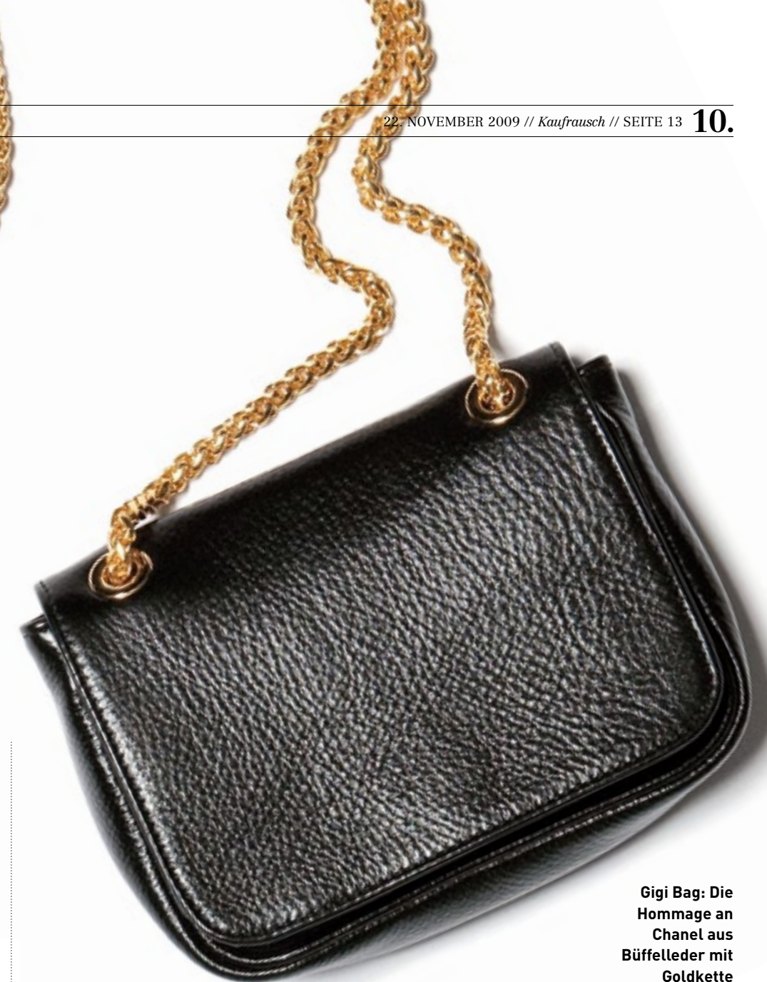
Gigi Bag: Die Hommage an Chanel aus Büffelleder mit Goldkette

Es ist ja keine einfache Sache, Taschen zu machen. Das Hausgemachte schlägt hier schneller durch als bei Kleidung. Ein paar ➤