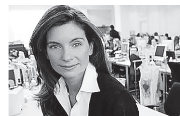
Erfolgreich: Natalie Massenet, 43

Die ehemalige Stylistin und Modejournalistin führt seit 9 Jahren erfolgreich ihr Fashion-Imperium. Sie kann den Unterschied zwischen der Stammkundin auf netaport.com und